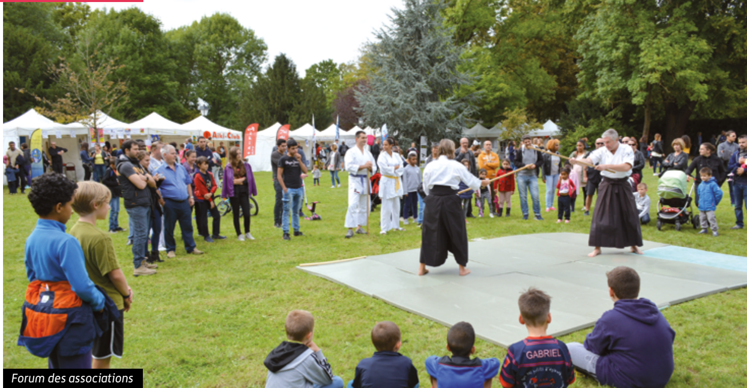
Forum des associations