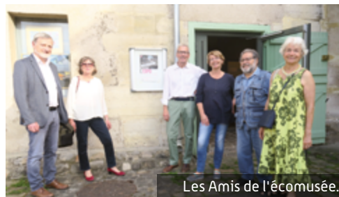
Les Amis de l'écomusée.

Avec "Partageons nos regards sur une banlieue étonnante", les Amis de l'écomusée proposeront une balade urbaine en écho à l'exposition Regards sur Fresnes, une banlieue qui étonne . Celle-ci parcourra la sud de la ville en faisant découvrir divers lieux "révélés". Rendez-vous à 15h à la Ferme de Cottinville.