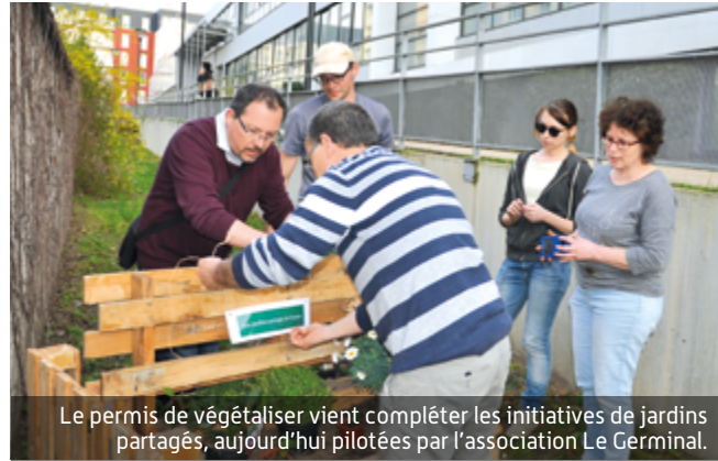
Le permis de végétaliser vient compléter les initiatives de jardins partagés, aujourd'hui pilotées par l'association Le Germinal.