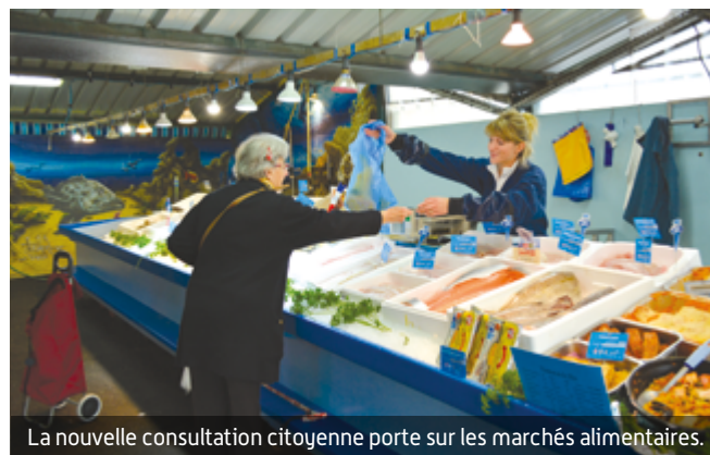
La nouvelle consultation citoyenne porte sur les marchés alimentaires.

Près de 300 personnes ont répondu au questionnaire sur les commerces du centre-ville qui a été diffusé en mai et juin. Celui-ci portait notamment sur les habitudes de consommation des Fresnois-es et leurs avis sur l'offre commerciale. Par exemple, 61% des répondants ont affirmé faire leurs courses en centre-ville. « Cette consultation avait notamment pour objectif d'appuyer notre candidature à l'appel à manifestation d'intérêt "centres-villes vivants" de la Métropole du Grand Paris, rappelle