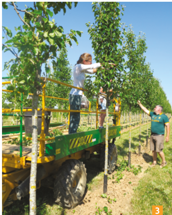
1 Du côté des serres de l'Ornemeau, préparation des plantes bisannuelles qui vont être prochainement livrées – certaines pour la Fête des jardins de Paris, fin septembre.