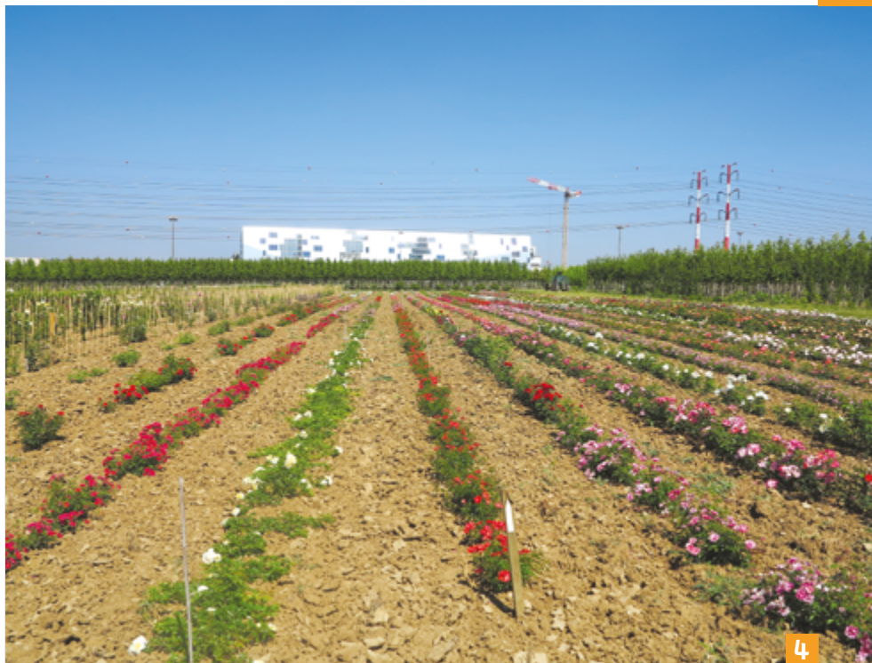
4 Vue depuis les champs de culture des rosiers, avec les alignements d'arbres dans le fond et à droite et, en ligne de mire, le bâtiment de l'ilot K de l'écoquartier de la Cerisaie.