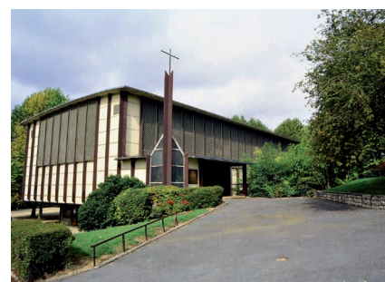
L'église Saint-Paul, ici photographiée en 1995, à la croisée de Fresnes et l'Haÿ-les-Roses.

Première tâche de la rénovation, le mur de vitraux. Imposant, d'une surface de 95 m 2 , le remettre à neuf n'est pas chose aisée. C'est l'atelier villejuifois Lucas Concept qui s'en charge. Pour le conserver à l'identique : prise de photos et croquis, puis démontage des 72 panneaux de l'œuvre de Jacques Colin-Guérin et André Ripeau. Les maîtres verriers retirent 120 pièces cassées puis s'attellent à retrouver les nuances de couleur exactes de l'original. Il leur faudra parfois commander une teinte spéciale.