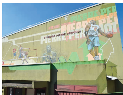
Le gymnase Pierre-Périquoi, temple des basketteurs, a fait l'objet d'une rénovation d'ampleur en 2019 pour un budget de plus d'1 million d'euros.

«Pour une petite ville, les infrastructures sportives sont exceptionnelles ! Que l'on soit au nord ou au sud de la ville, les Fresnois ont accès à des équipements sportifs et des activités variées», s'enjoue Marouan El Amrani, adjoint à la maire délégué notamment aux Sports. En effet,