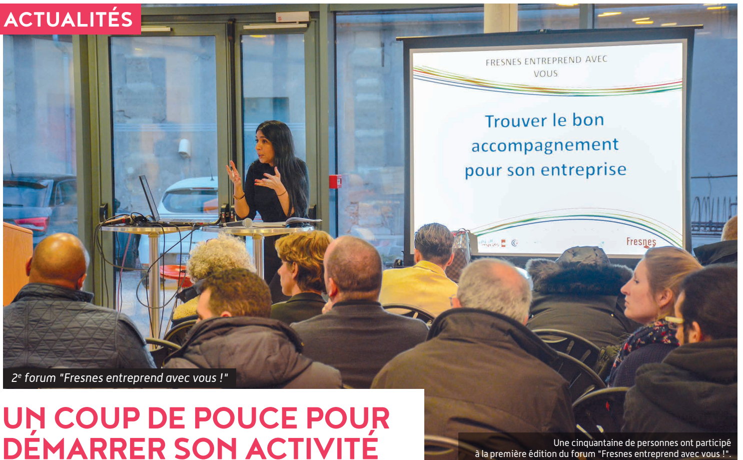
2 e forum "Fresnes entreprend avec vous !"