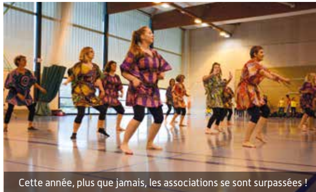
Cette année, plus que jamais, les associations se sont surpassées !

L'AFM-Téléthon a reconnu l'investissement et l'engagement des associations fresnoises sur les deux dernières années ».