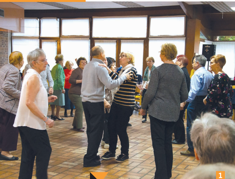
Clubs de seniors