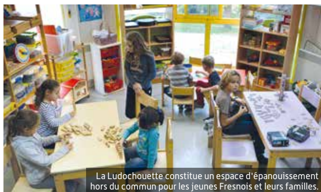
La Ludochochette constitue un espace d'épanouissement hors du commun pour les jeunes Fresnois et leurs familles.