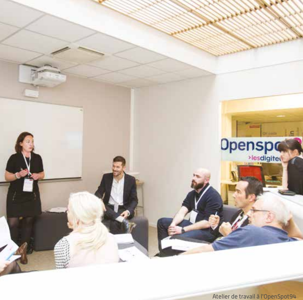
Atelier de travail à l'OpenSpot94