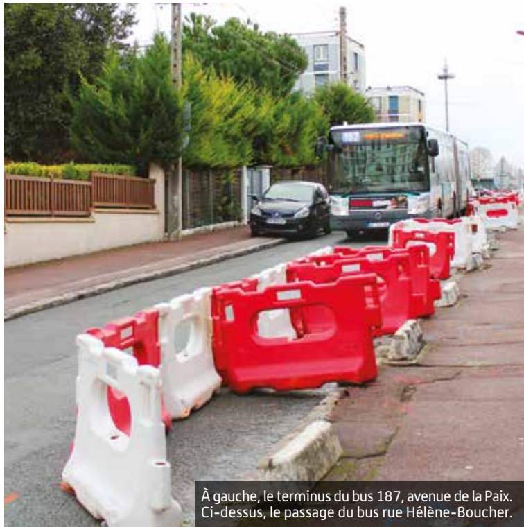
À gauche, le terminus du bus 187, avenue de la Paix. Ci-dessus, le passage du bus rue Hélène-Boucher.