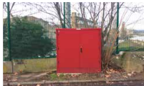
En haut, l'armoire internet vandalisée rue Jean-Moulin. En bas, les réparations sont réalisées.