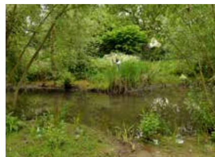
Le parc des Prés de la Bièvre (avenue de la Liberté), en 2013, lors d'une animation pour célébrer ses dix ans.

Cependant, toute cette ferveur industrielle contribue à la disparition de la Bièvre comme rivière à part entière. En