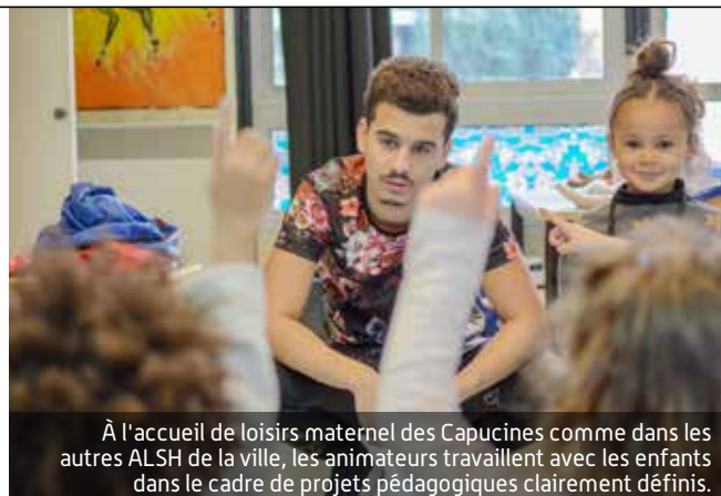
À l'accueil de loisirs maternel des Capucines comme dans les autres ALSH de la ville, les animateurs travaillent avec les enfants dans le cadre de projets pédagogiques clairement définis.

Le dispositif doit permettre de « faire du mercredi un jour ludique en phase avec l'enseignement ». Dans ce cadre, les communes sont invitées à mettre en cohérence les projets d'école et les projets pédagogiques des accueils de loisirs, tout en proposant aux enfants des activités éducatives et culturelles à forte valeur ajoutée, directement en lien avec les acteurs du territoire. À Fresnes, la fin d'année a vu l'obtention de la