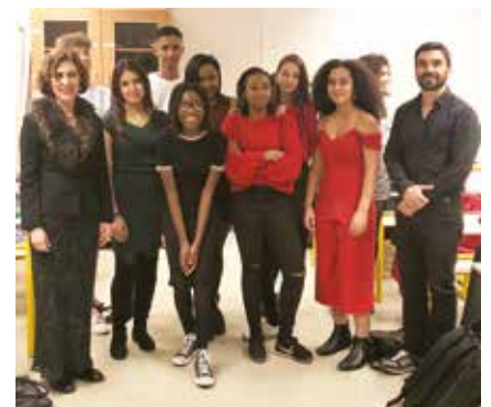
Les classes de Seconde 7 et 16 du lycée Frédéric-Mistral ont participé au mois de l'ESS avec leurs professeurs.