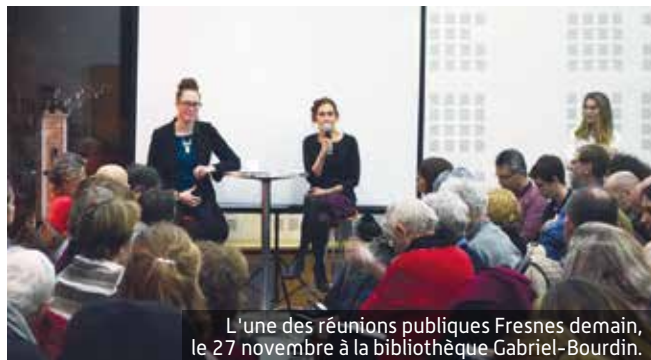
L'une des réunions publiques Fresnes demain, le 27 novembre à la bibliothèque Gabriel-Bourdin.