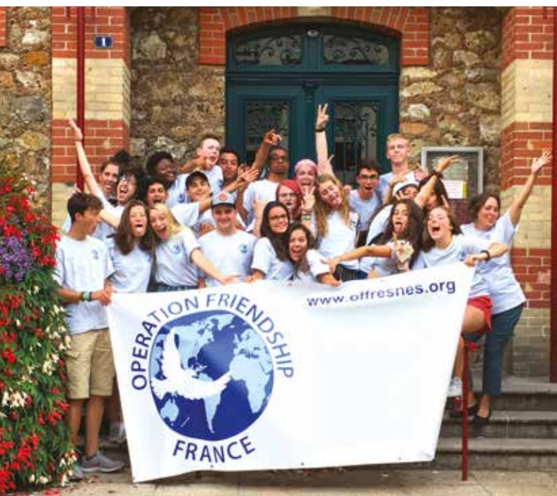
L'été dernier, les jeunes Fresnois ont accueilli leurs amis américains