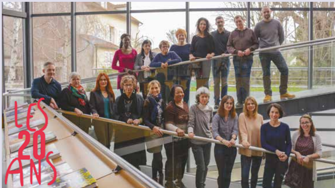
Bibliothèque municipale Gabriel-Bourdin.

La bibliothèque municipale Gabriel-Bourdin célébrera ses 20 ans tout au long de l'année 2019 à travers un programme très riche d'ateliers, d'expositions et de conférences. Deux grands rendez-vous à retenir : un mois d'avril inédit autour du numérique et un vrai banquet médiéval en septembre. Préparez les bougies !